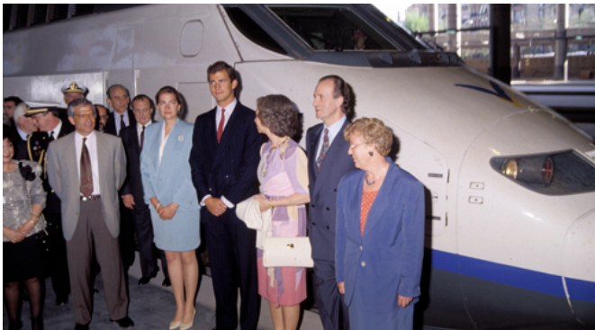
Foto: Los Reyes de España en la inauguración de la línea Madrid-Sevilla el 21 de abril de 1992.

Región de Murcia que impiden la cohesión territorial y favorece el aislamiento de nuestro territorio, a lo que se suma el alto coste de oportunidad de no poder hacer desplazamientos rápidos a Madrid o facilitar que vengan empresarios y turistas de otras zonas de España de forma cómoda. La adaptación de nuestras infraestructuras ferroviarias al ancho de vía necesario para el corredor mediterráneo de mercancías es otra prioridad, que si bien no es tan acuciante como las conexiones para el transporte de pasajeros, se convierte en un objetivo estratégico a medio y largo plazo del que no podemos volver a quedar rezagados.